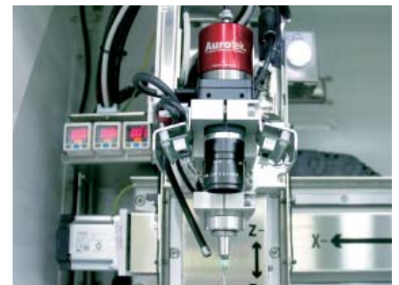
Fiducial Mark Alignment