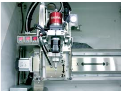
Bit Sliding & Breaking Detection