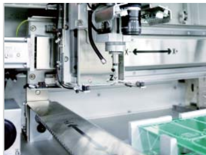
CCD Camera System