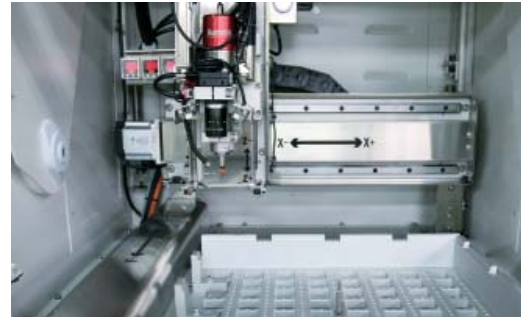
Specific Fixture Identification