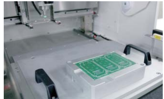
Universal Fixture / Specific Fixture